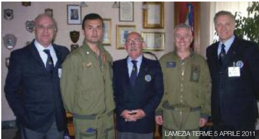
LAMEZIA TERME 5 APRILE 2011

I Soci, suddivisi in 9 Sezioni, non coprono tutto il territorio nazionale; la Sezione più a Sud è la “Tucano” di Roma e recentemente sono stati fatti concreti passi che fanno sperare, ben presto, nella costituzione di una Sezione a Lamezia Terme che, intorno al polo del 2° Reggimento “Sirio”, possa divenire il sicuro riferimento dell’Italia Meridionale. 4